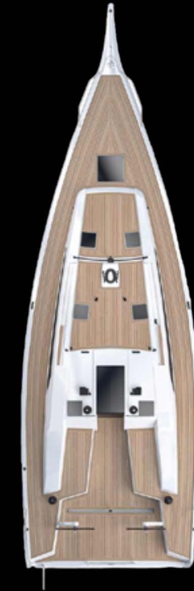
Top View GS 40 PERFORMANCE