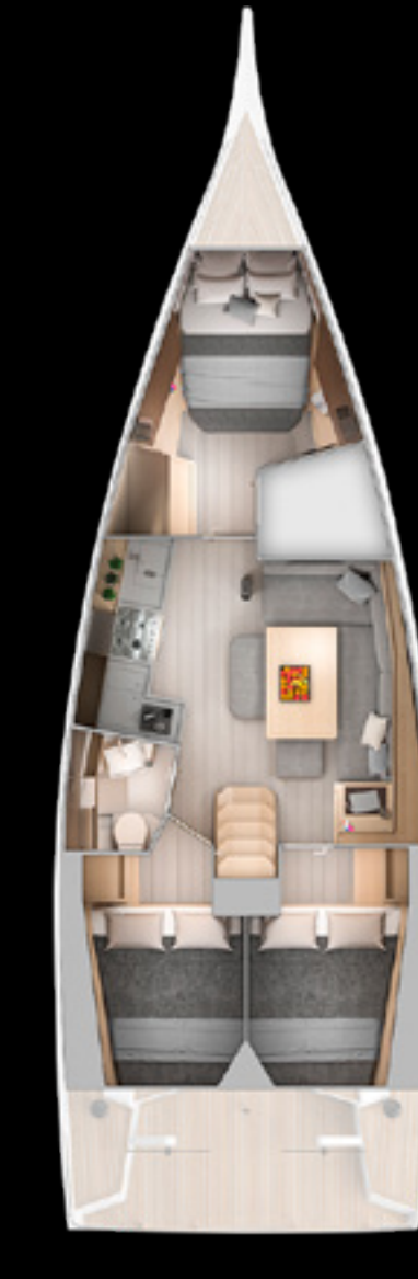
Interior View GS 40 - STANDARD