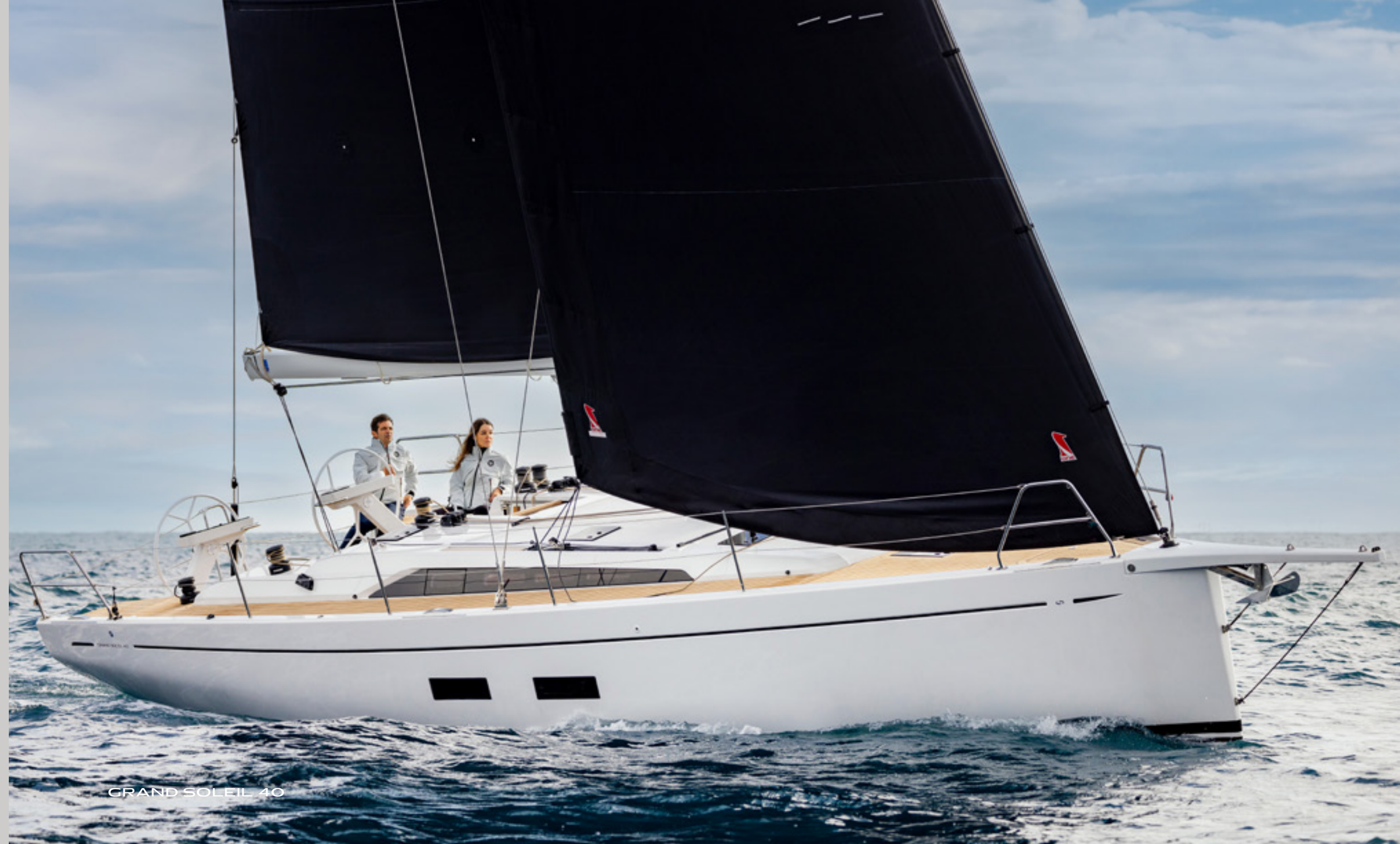
GRAND SOLEIL 40