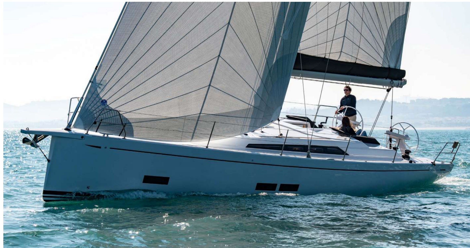
GS 44 PERFORMANCE