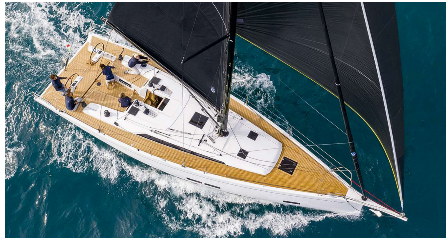
GS 44 RACE

Come il Grand Soleil 48, anche il Grand Soleil 44 è disponibile in una doppia versione. Performance, con un setup del piano velico e di coperta che permettono di navigare con manovre semplificate. Race, con un carattere e un'identità da regata. Per entrambe stile, eleganza e riconoscibilità confermano il denominatore comune di tutta la gamma Grand Soleil.