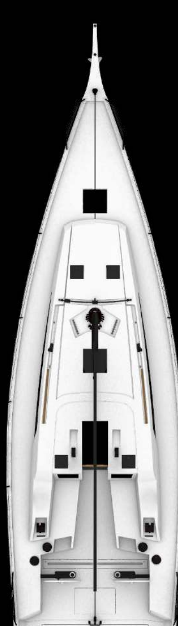
Top View GS 44 PERFORMANCE